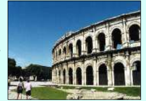
Arènes de Nîmes

En raison des chiens, chats, chevaux, ... présents sur l'exploitation, nous regrettons de ne pouvoir accepter d'autres animaux.